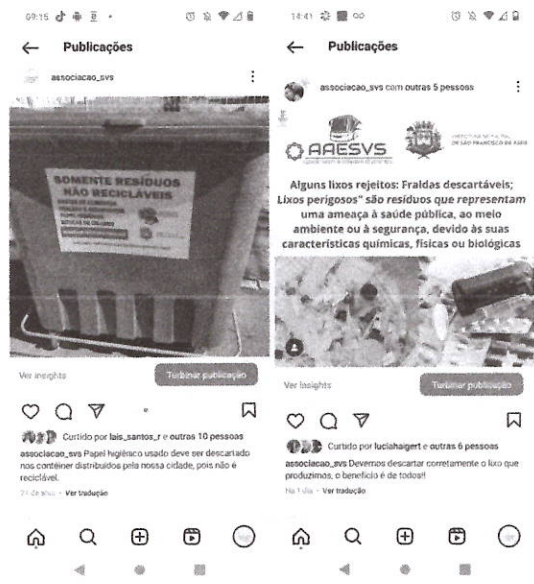
Publicações no Facebook: Associação dos Estudantes de São Vicente do Sul